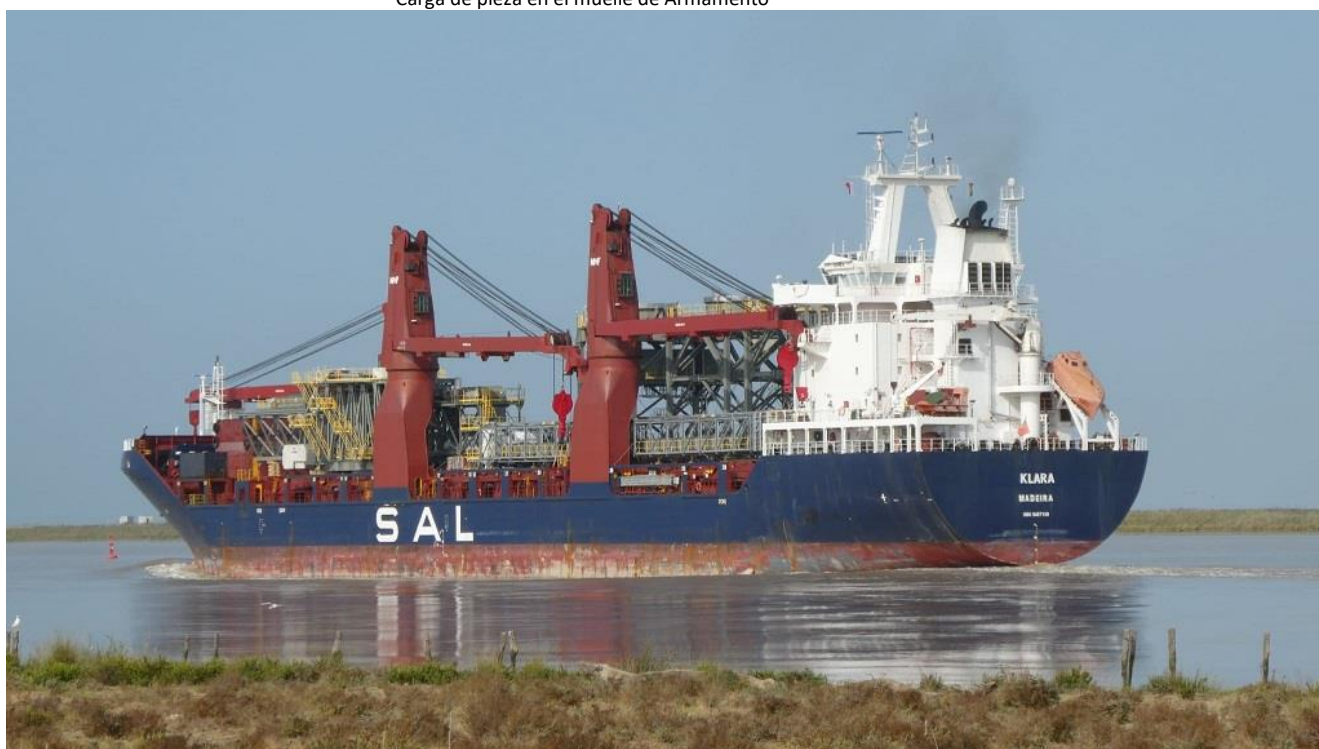
Salida del Puerto de Sevilla rumbo a Canadá