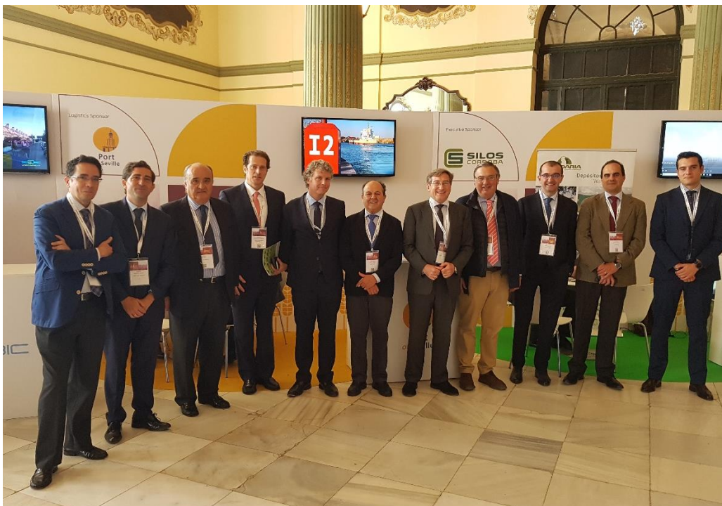
El presidente de la APS junto a la Comunidad Portuaria

Como actividad complementaria al encuentro, los asistentes a la Bolsa de Materias Primas han podido visitar las instalaciones portuarias con un recorrido en barco.