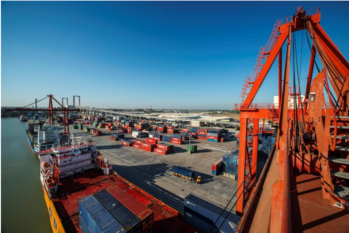
Muelle del Centenario

Autoridad Portuaria de Sevilla División de Comunicación y Relaciones Externas comunicacion@apsevilla.com