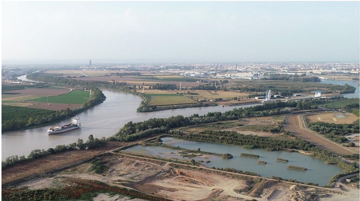
Fotografía aérea de los vacaderos terrestres del Puerto de Sevilla adaptados con islas para favorecer la cría de aves