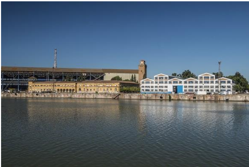
Muelle de Armamento

Para descargar fotografías: https://we.tl/t-roYbHr9BNA