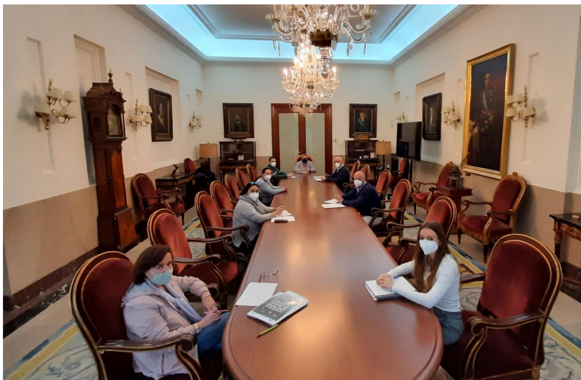
Primer encuentro de la comisión negociadora