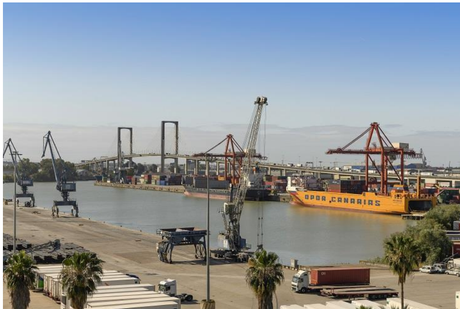
Dársena de Batán