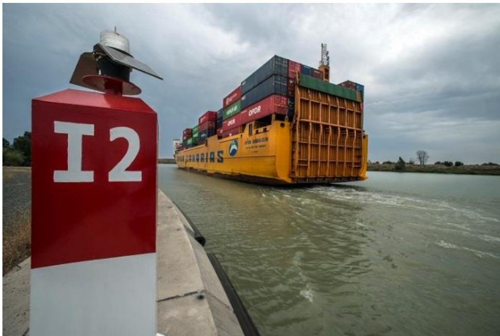
OPDR Canarias aproximándose a la esclusa 'Puerta del Mar'

En torno al Puerto de Sevilla hay cerca de 200 empresas, tanto portuarias como dependientes del mismo; las cuales generan más de 20.000 puestos de trabajo. El impacto sobre la economía de dicha industria portuaria y de la dependiente del Puerto supera los 1.100 millones de euros. Esto supone el 3% del PIB de la provincia de Sevilla y casi el 1% del de la Comunidad Autónoma andaluza.