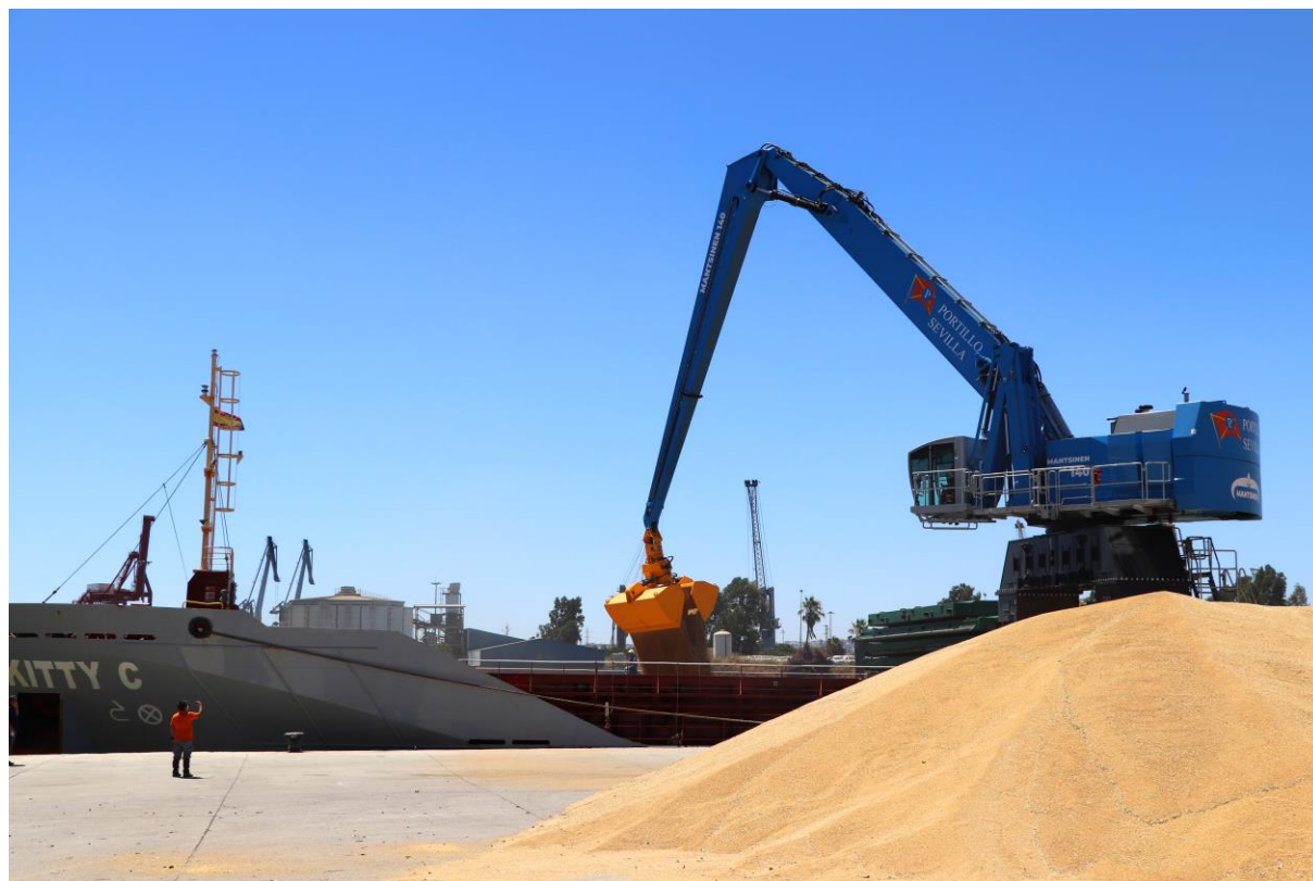
Primera operativa de la nueva grúa del Puerto de Sevilla en la que ha cargado cereal

El Puerto de Sevilla tiene cinco terminales portuarias concesionadas y tres muelles públicos, más de 4.000 metros de línea de atraque y un millón de metros cuadrados de almacenes.