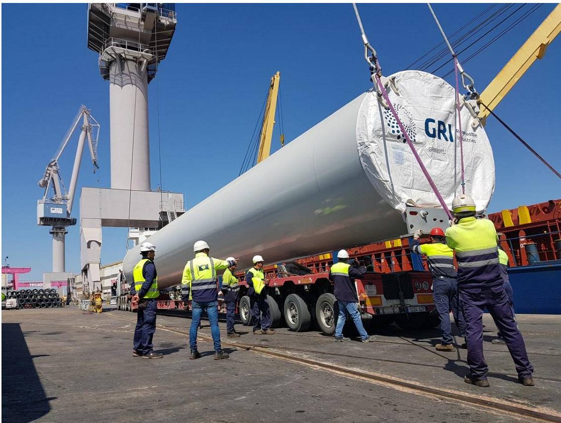
Imagen de la operativa en la Terminal Portuaria Esclusa del Puerto de Sevilla

GRI Renewable Industries ( www.gri.com.es ) desde 2008 desarrolla su actividad de fabricación de torres y bridas para el sector de la energía eólica. Actualmente, cuenta con 16 plantas de fabricación de torres, bridas eólicas y productos de fundición en España, Estados Unidos, Brasil, Argentina, China, Turquía, India y Sudáfrica; suministrando torres y bridas de alta calidad para la fabricación de aerogeneradores en todo el mundo. Esto ha permitido a la compañía cerrar 2018 con unas ventas de cerca de 400 millones de euros y más de 3.500 empleados.