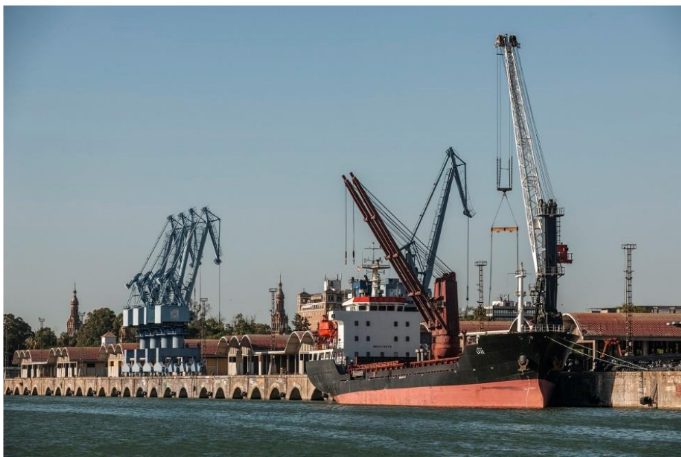
Muelle de Tablada

En torno al Puerto de Sevilla hay cerca de 200 empresas, tanto portuarias como dependientes del mismo; las cuales generan más de 20.000 puestos de trabajo. El impacto sobre la economía de dicha industria portuaria y de la dependiente del Puerto supera los 1.100 millones de euros. Esto supone el 3% del PIB de la provincia de Sevilla y casi el 1% del de la Comunidad Autónoma andaluza.