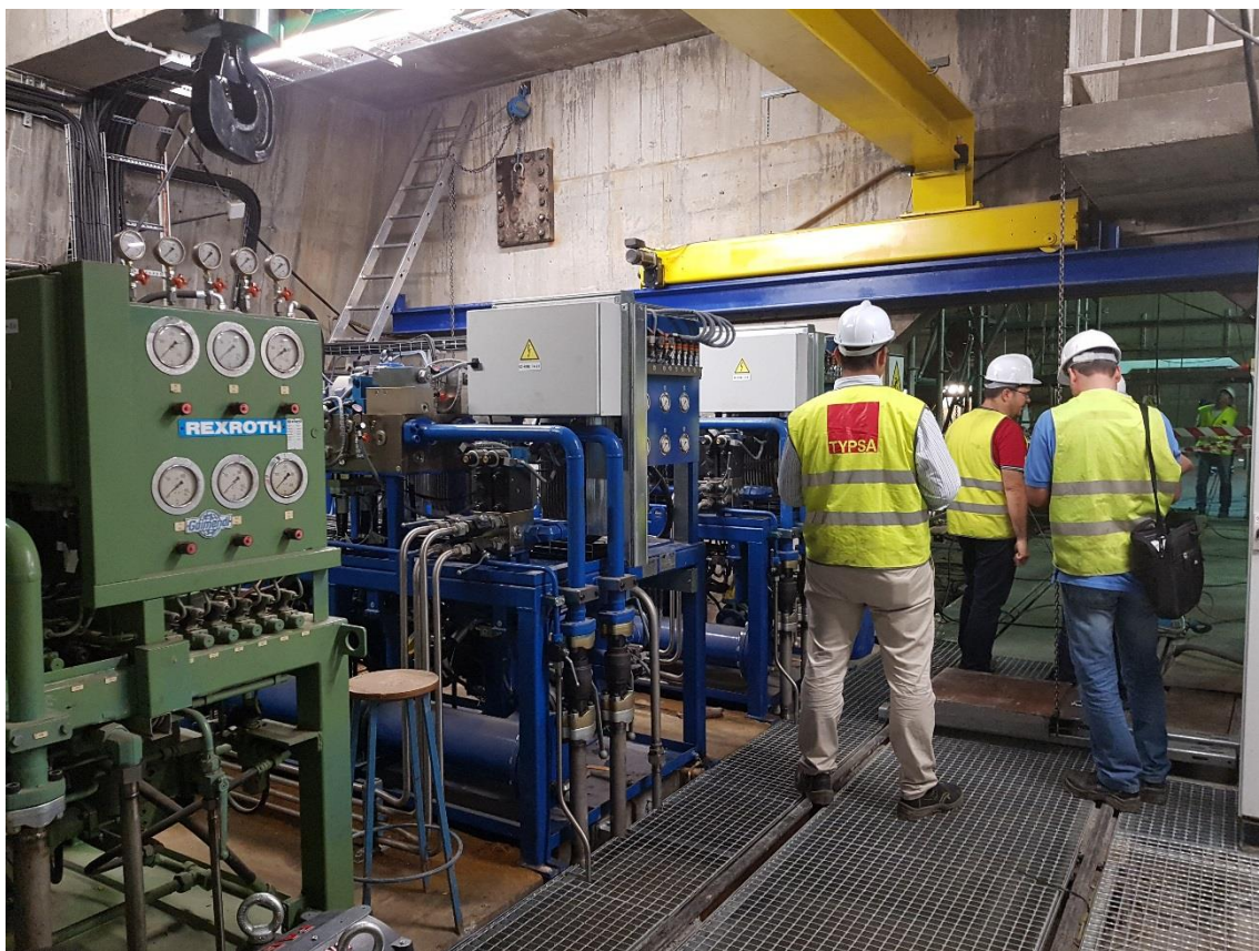
Vista del interior del Puente de las Delicias

supera los 1.100 millones de euros. Esto supone el 3% del PIB de la provincia de Sevilla y casi el 1% del de la Comunidad Autónoma andaluza.